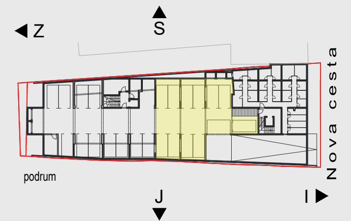
GARAŽNO PARKIRALIŠNA MJESTA (GPM)_PODRUM