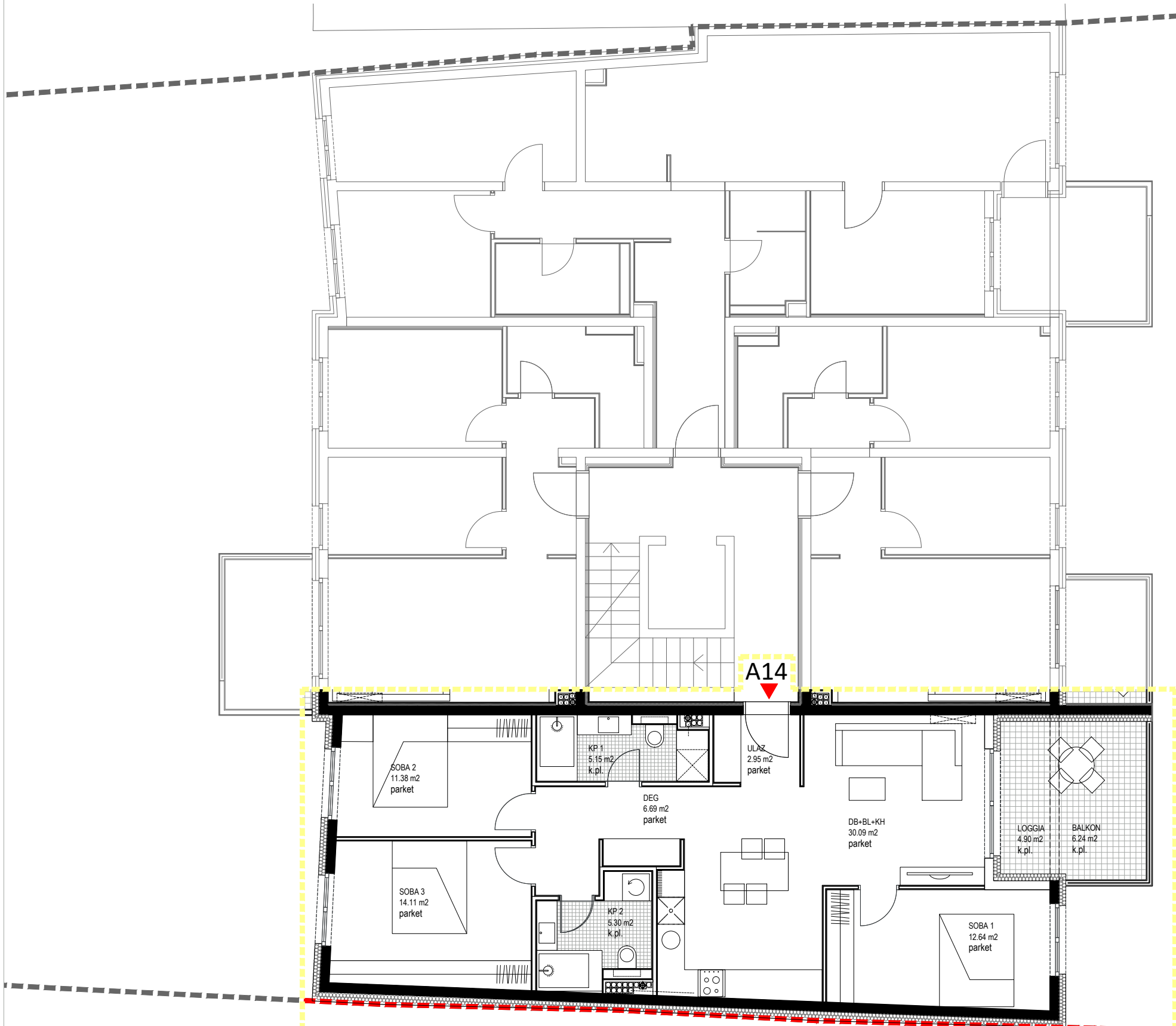
ČETVEROSOBNI STAN_4. KAT_STAN A14