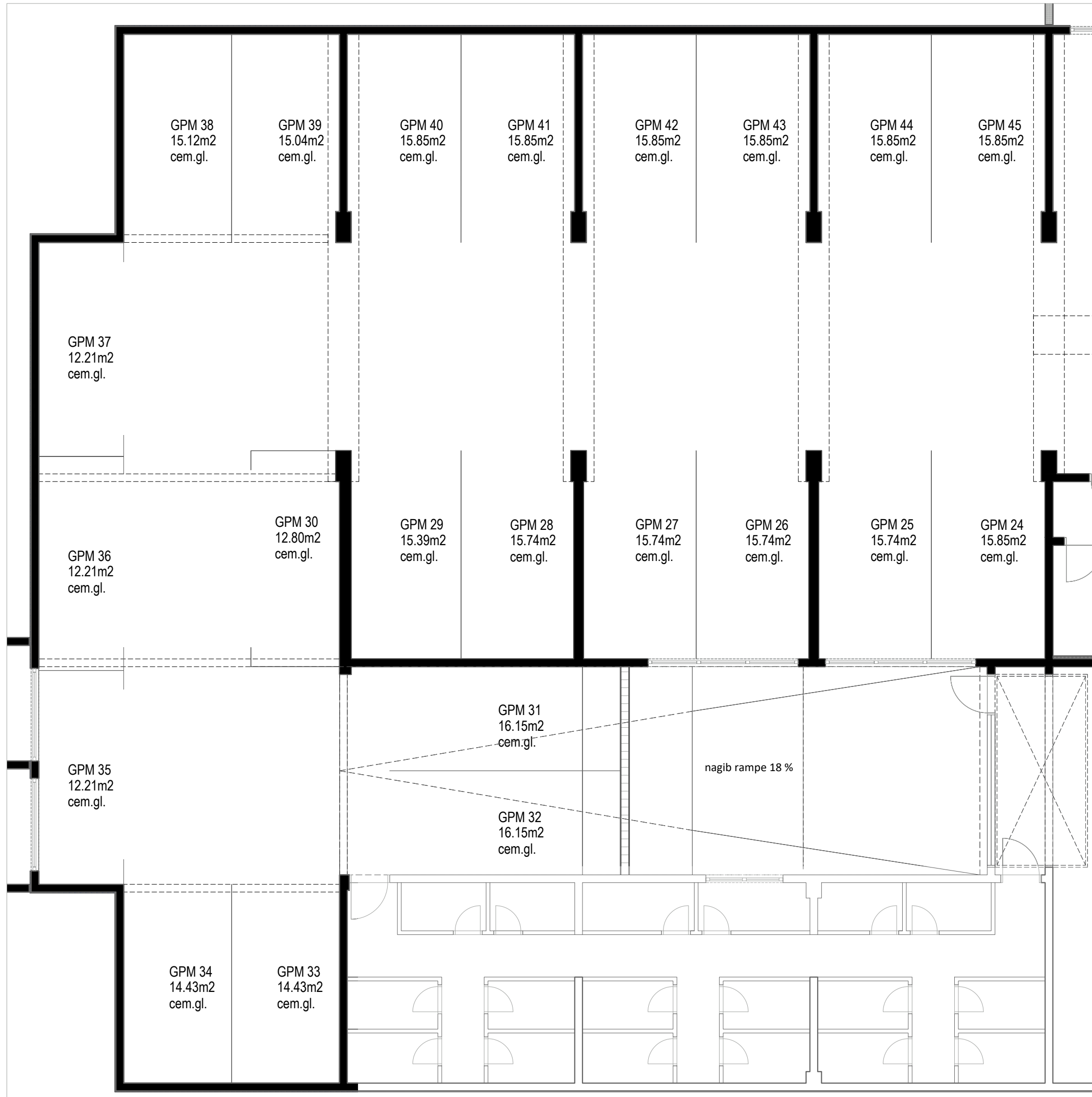
GARAŽNO PARKIRALIŠNA MJESTA (GPM)_PODRUM